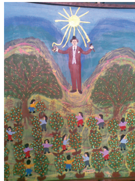
Goyo con los naranjales de Bejuma , 2007 Acrílico sobre tela 100 x 100 cm Colección del artista