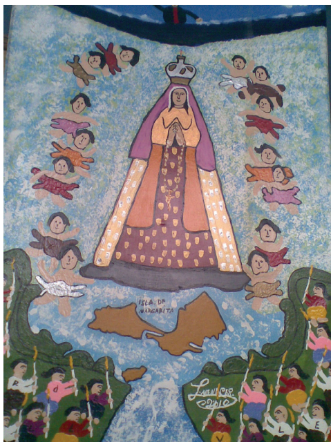
Virgen del Valle con Goyo , 2010 Acrílico sobre tela 63 x 93 cm Colección del artista