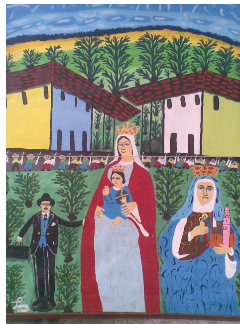
La Coromoto, el doctor José Gregorio Hernández y Santa Eduvigis , 2009 Acrílico sobre tela 127 x 104 cm Colección del artista