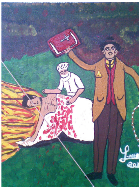
El Venerable , 2012 Acrílico sobre tela 50 x 40 cm Colección del artista

Esta exposición que hoy se realiza fue titulada "Luis Meneses. En honor al Venerable, por su beatificación" y está enmarcada en el proyecto que lleva a cabo el Cinap denominado Artistas al día , en el que los diversos creadores registrados y que mantienen su información artística actualizada cuentan con un espacio para mostrar sus obras.