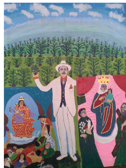
Las tres guías mías, 2008. Acrílico sobre tela. 100 x 120 cm Colección del artista

En el marco del proyecto expositivo Artistas al día del Centro de Información y Documentación Nacional de las Artes Plásticas (Cinap)