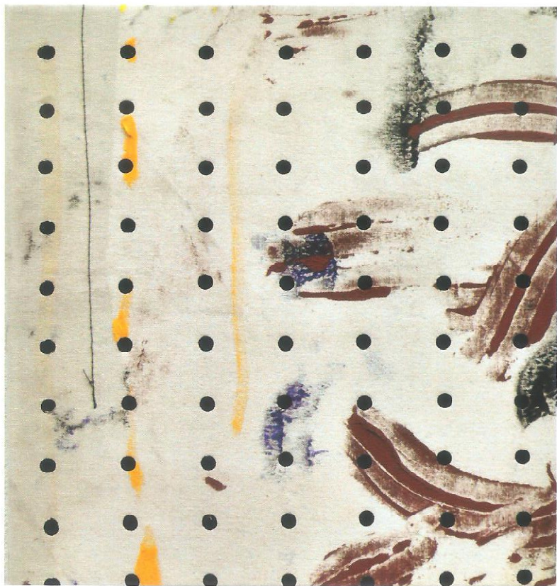
PLANO 4, 2012 | Acrílico sobre tela | 37 x 35 cm