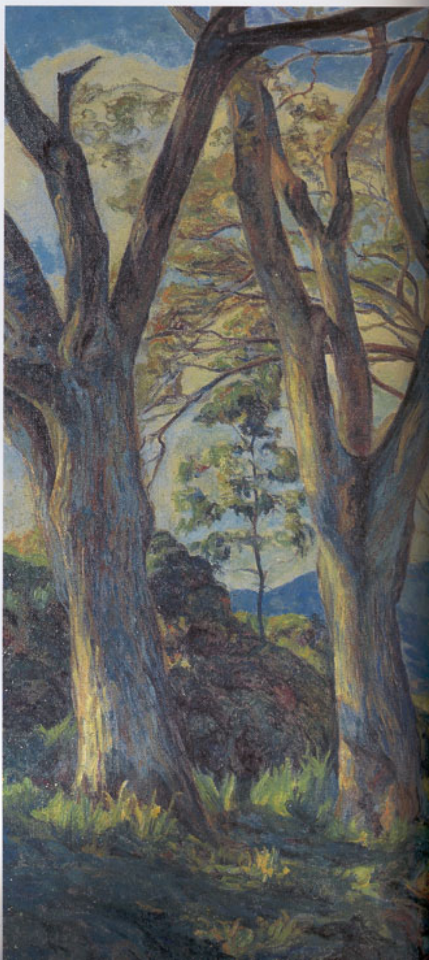
Plaza La Estrella, San Bernardino