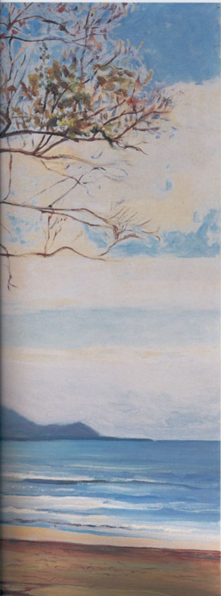
Mar de Higerote 1957