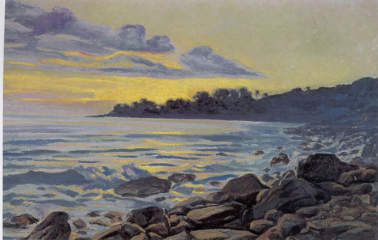
Amanecer Por Punta de Mulatos , 1944, Oleo sobre tela, 38 x 55 cms., Col. Domínguez y Cia.