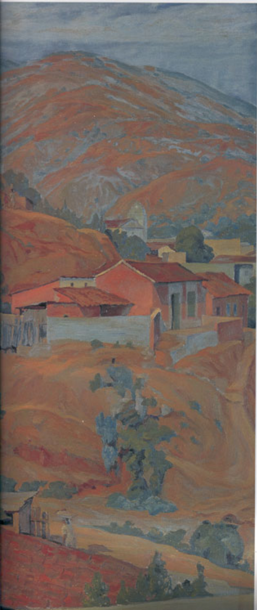
Paisaje de Maiquetía