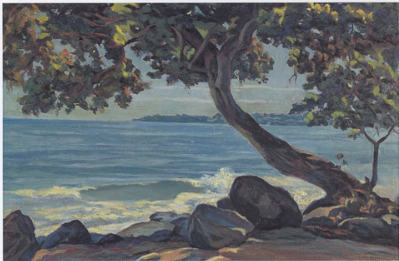
Ucero del Playón, Macuto, 1944. Oleo sobre tela, 38 x 55,5 cms., Col. Domínguez y Cia.